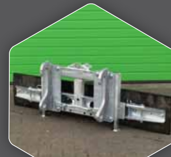
DIREKT AUF DEM 270 BLATT