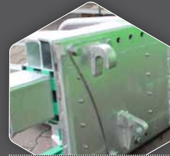
OPTIONALE KOPPELRAHMEN MIT BOLZEN MONTIERT