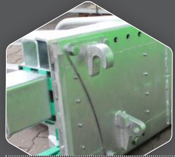
OPTIONALE KOPPELRAHMEN MIT BOLZEN MONTIERT