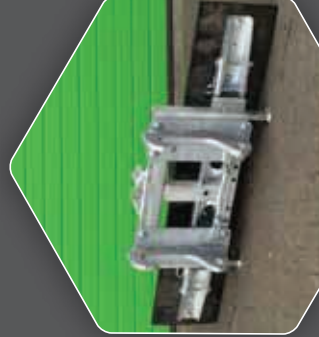
DIREKT AUF DEM 270 BLATT