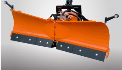
Schneeflug PRONAR PUV1350/1500/1800/2000M

(alle Preise zzgl. MwSt. + Frachtkosten)