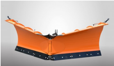
Schneeschild PUV-4000HD/ PUV-3600HD

Das Schneeschild dient zur Schneeräumung von Straßen, Plätzen, Parkplätzen und anderen gehärteten Wegen und Gehwegflächen.