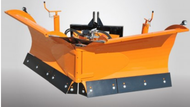
Schneeschild PUV-2600 M, PUV-2800 M, PUV-3000 M, PUV-3300 M

Das Schneeschild dient zur Schneeräumung von Straßen, Plätzen, Parkplätzen und anderen gehärteten Wegen und Gehwegflächen.