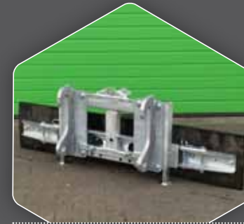
DIREKT AUF DEM 270 BLATT