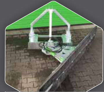
SCHWENKPUNKT 60° GUT GEEIGNET FÜR FUTTERANSCHIEBEN