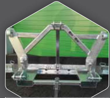
OPTIONAL: 3IN1 BOCK DREIPUNKT, GABELSTAPLER, EURO