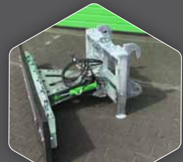
UNIVERSAL MONTAGEPLATTE MIT KOPPELRAHMEN NACH WAHL