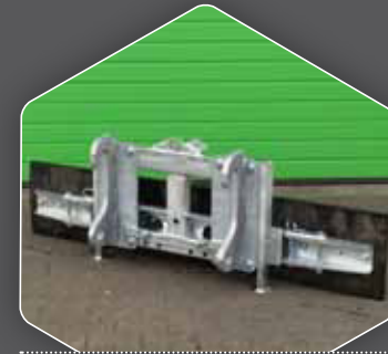
DIREKT AUF DEM 270 BLATT