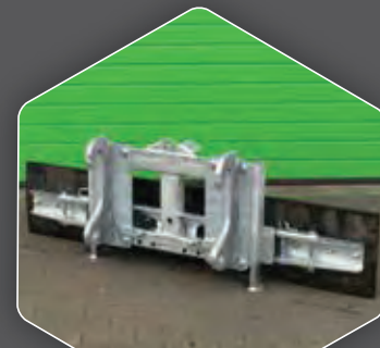
DIREKT AUF DEM 270 BLATT