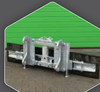
DIREKT AUF DEM 270 BLATT